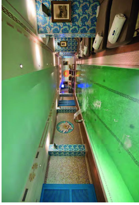
SWISS DIAMOND HOTEL, VICO MORCOTE, LUGANO