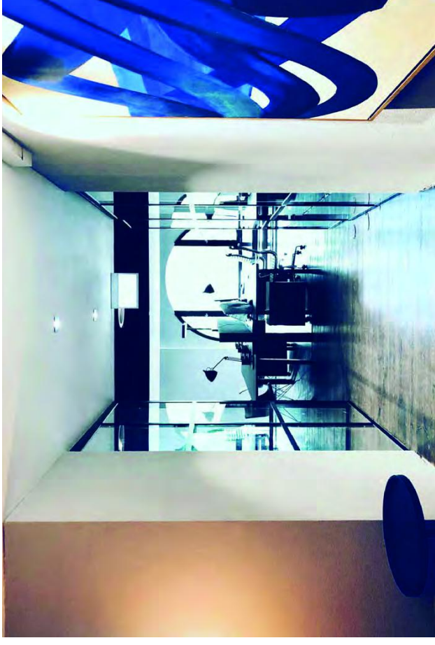
BÜROGEBÄUDE UMBAU MONOSTREAM ZÜRICH

AN ERSTER STELLE STEHEN JEDOCH OFFENHEIT UND VER- TRAUEN GEGENÜBER UNSEREN GESCHÄFTSPARTNERN UND ZU UNSEREN MITARBEITERINNEN UND MITARBEITERN. FAIRNESS UND PARTNERSCHAFT IN DER ZUSAMMENARBEIT, ZUVER- LÄSSIGKEIT UND LEGALITÄT SIND WERTE, DIE UNS LEITEN.