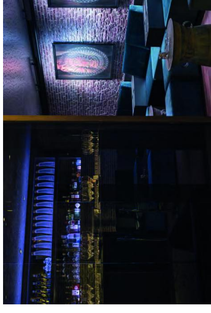
ALICE CHOO CLUB & RESTAURANT, ZÜRICH

AN ERSTER STELLE STEHEN JEDOCH OFFENHEIT UND VER- TRAUEN GEGENÜBER UNSEREN GESCHÄFTSPARTNERN UND ZU UNSEREN MITARBEITERINNEN UND MITARBEITERN. FAIRNESS UND PARTNERSCHAFT IN DER ZUSAMMENARBEIT, ZUVER- LÄSSIGKEIT UND LEGALITÄT SIND WERTE, DIE UNS LEITEN.